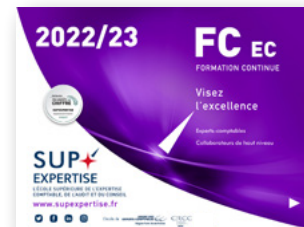
Formations Experts-comptables et collaborateurs de haut niveau