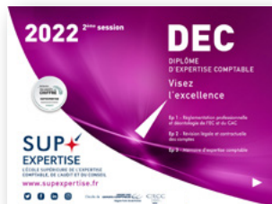
Préparations au DEC