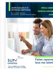
Centre de bilans et de gestion des compétences