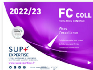
Formations Collaborateurs de haut niveau - confirmés - débutants et assistants